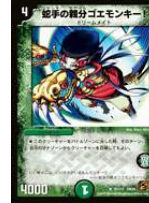
[ DM-36 ] 蛇手の親分ゴエモンキー！