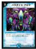
[DM-16] パラダイス・アロマ