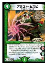
[ DMX-12 ] アラゴト・ムスピ