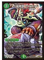
[ DMR-19 ] S級原始 サンマッド