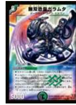
[ DM-13 ] 無双恐皇ガラムタ