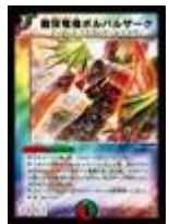
[ DM-10 ] 無双竜機ボルバルザーク