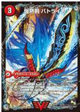
[ DMX-18 ] 爆熱剣 バトライ刃/爆熱天守 バトライ閣/爆熱DX バトライ武神