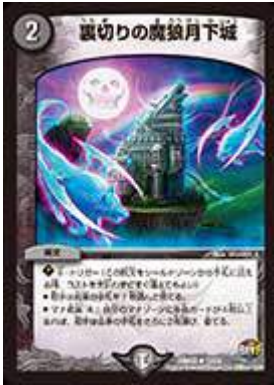
[ DMR-22 ] 裏切りの魔狼月下城