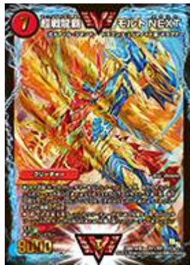
[ DMR-16 極 ] 超戦龍覇 モルトNEXT