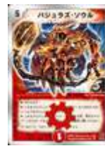
[DM-15] バジュラズ・ソウル