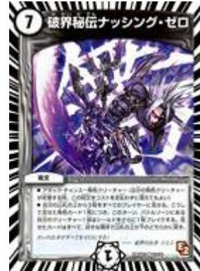
[ DMX-13 ] 破界秘伝ナッシング・ゼロ