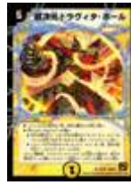
[DM-37] 超次元ドラヴィタ・ホール