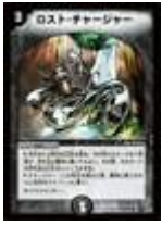
[ DM-09 ] ロスト・チャージャー