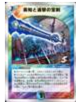
[ DM-11 ] 英知と追撃の宝剣