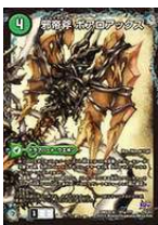
[DMX-18] 邪帝斧 ボアロアックス/ 邪帝遺跡 ボアロバグス/ 我臥牙 ヴェロキボアロス