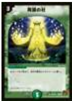
[ DM-36 ] 再誕の社