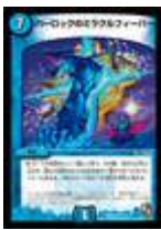
[DMR-01] パーロックのミラクルフィーバー