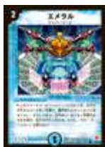
[ DM-03 ] エメラル