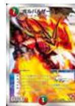
[DMX-04] ボルバルザーク・エクス