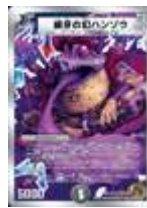
[DM-29] 威牙の幻ハンゾウ