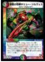
[ DM-25 ] 鐘巫の咆哮キリュー・ジルヴェス