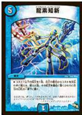
[ DMR-16 極 ] 龍素知新