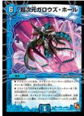
[ DMR-01 ] 超次元ガロウズ・ホール