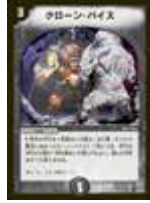
[ DM-12 ] クローン・バイス