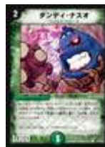
[ DM-17 ] ダンディ・ナスオ