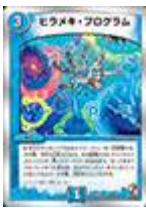
[DMR-05] ヒラメキ・プログラム