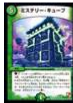
[ DMR-09 ] ミステリー・キューブ