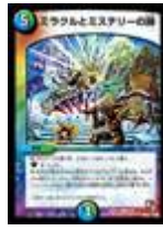
[ DMC-26 ] ミラクルとミステリーの扉