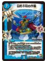
[ DMX-24 ] 目的不明の作戦