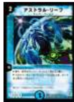
[ DM-04 ] アストラル・リーフ