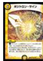
[DM-32] ポジロン・サイン