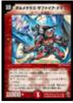
[ DMC-27 ] ボルメテウス・サファイア・ドラゴン