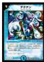
[ DM-04 ] アクアン