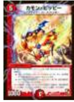
[ DMR-03 ] カモン・ビッピー