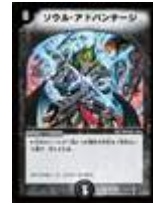
[ DM-28 ] ソウル・アドバンテージ