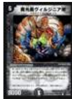
[ DM-30 ] 魔光蟲ウィルジニア卿