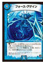
[DMR-23] フォース・アゲイン