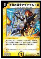
[ DM-28 ] 天雷の導士アヴァラルド公