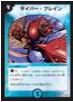
[ DM-01 ] サイバー・プレイン