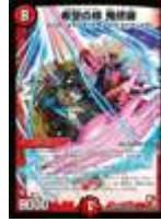
[ DMR-08 ] 希望の絆 鬼修羅