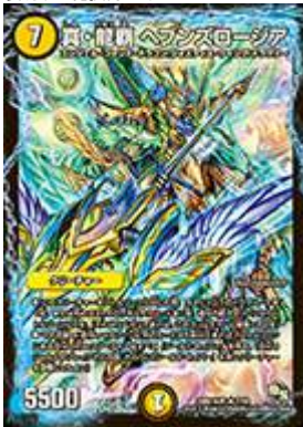
[ DMR-16 真 ] 真・龍覇 ヘブンスロージア