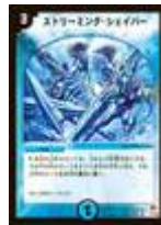
[ DM-03 ] ストリーミング・シェイパー