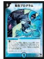
[ DM-10 ] 転生プログラム