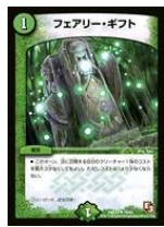
[DM-14] フェアリー・ギフト