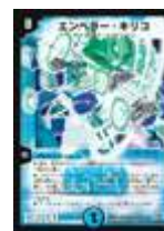
[ DM-32 ] エンペラー・キリコ