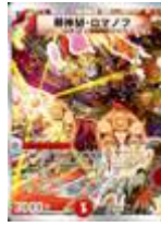
[ DMC-58 ] 邪神 M・ロマノフ