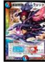
[ DMR-08S ] 疾封怒闘キューブリック