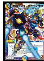
[ DMR-02 ] 常勝ティス・オブティマス