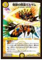
[ DM-29 ] 奇跡の精霊ミルザム