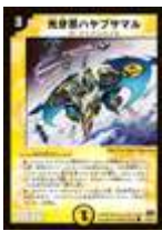
[DM-29] 光牙忍ハヤブサマル