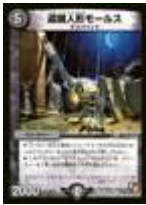
[ DM-16 ] 盗掘人形モールス