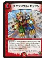
[ DMR-22 ] スクラブル・チェンジ