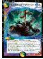
[ DMR-02 ] 超次元ホワイトグリーン・ホー ル