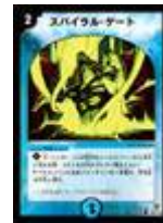
[ DM-01 ] スパイラル・ゲート