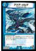
[ DM-37 ] アクア・メルゲ