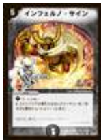
[ DMC-44 ] インフェルノ・サイン