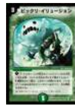
[DM-20] ビックリ・イリュージョン