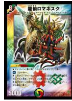
[ DM-25 ] 龍仙ロマネスク