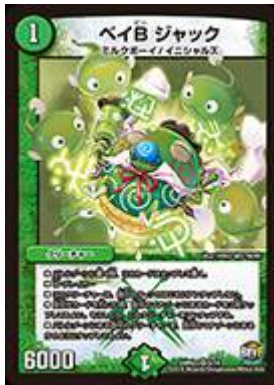
[ DMR-23 ] ベイB ジャック