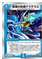
[ DM-31 ] 蒼狼の始祖アマテラス