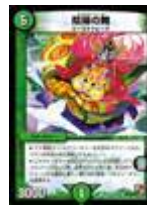
[ DM-39 ] 陰陽の舞