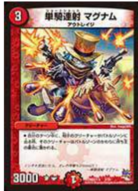
[ DMD-27 ] 単騎連射 マグナム