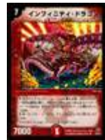
[ DM-22 ] インフィニティ・ドラゴン