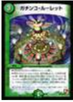
[ DMR-07 ] ガチンコ・ルーレット