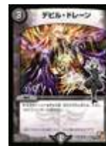
[ DM-03 ] デビル・ドレーン