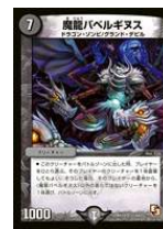
[DMX-14] 魔龍バベルギヌス