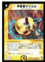
[ DM-08 ] 予言者マリエル