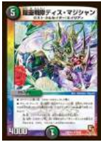
[ DMR-03 ] 鐘巫戦隊ディス・マジシャン