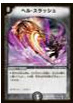
[ DM-06 ] ヘル・スラッシュ