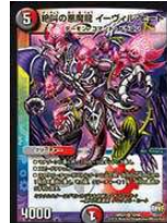
[ DMR-21 ] 絶叫の悪魔龍 イーヴィル・ヒート