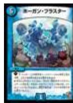
[DM-39] ホーガン・プラスター