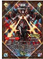
[DMR-19] 禁断 ～封印されし X～/伝説 の禁断 ドキンダム X