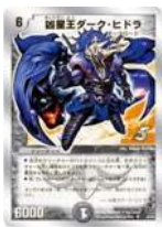
[ DMC-13 ] 凶星王ダーク・ヒドラ