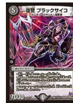
[DMR-17] 復讐 ブラックサイコ