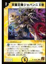
[ DM-36 ] 天雷王機ジョバンニ X 世