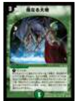
[ DM-10 ] 母なる大地