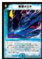
[ DM-29 ] 斬隠オロチ