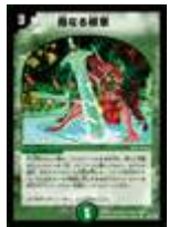
[ DM-24 ] 母なる紋章