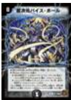
[ DM-37 ] 超次元バイス・ホール