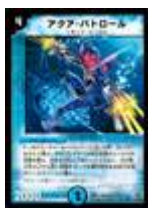
[ DM-15 ] アクア・バトロール