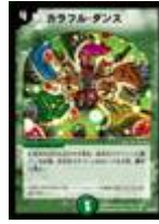
[ DM-27 ] カラフル・ダンス