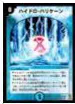
[DM-04] ハイドロ・ハリケーン