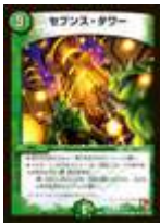
[ DM-14 ] セブンス・タワー