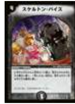
[ DM-08 ] スケルトン・バイス