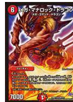
[ DMR-17 ] メガ・マナロック・ドラゴン