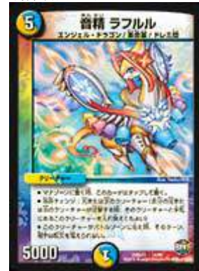
[ DMX-23 ] 音精 ラフルル