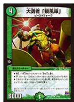
[ DMX-22 ] 大勇者「鎖風車」