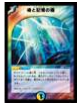
[ DM-11 ] 魂と記憶の盾