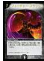
[ Y3 プロモ ] フューチャー・スラッシュ