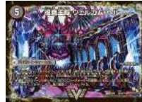
[ DMR-16 極 ] 極魔王殿 ウェルカム・ヘル / 極・魔壊王 デスゴロス