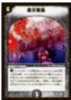
[ DM-10 ] 魔天降臨