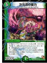
[ DMR-01 ] 次元流の豪力