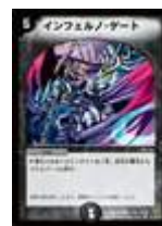
[ DM-19 ] インフェルノ・ゲート