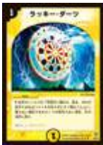
[ DM-12 ] ラッキー・ダーツ